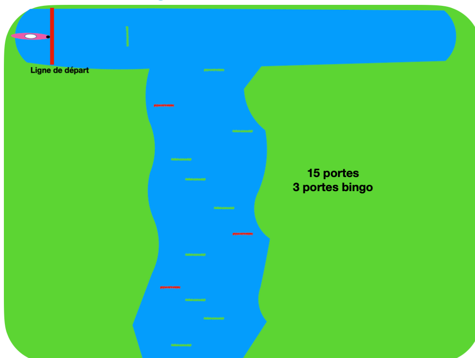
Figure course de slalom

OPEN ( même parcours que les autres mais en bateau de leur choix )