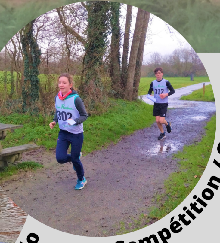
Compétition / Open