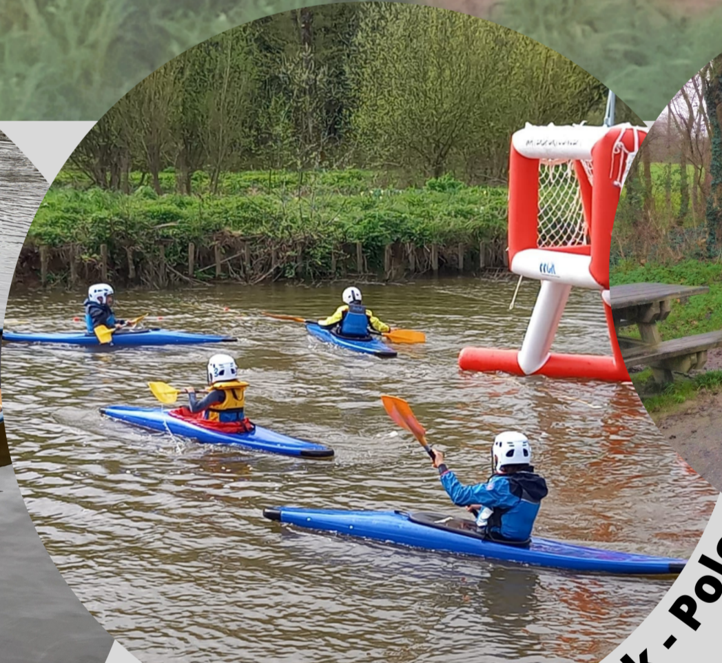
Course en ligne / Kayak - Polo