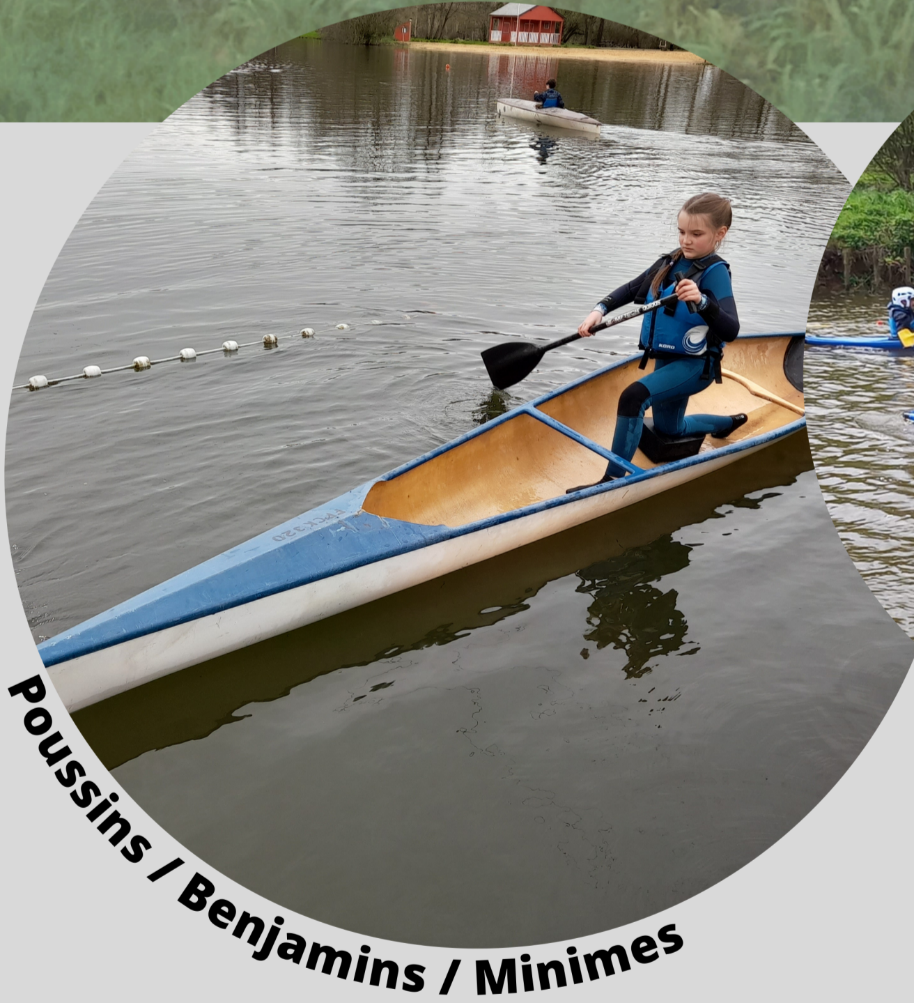
Poussins / Benjamins / Minimes